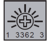
érezkelési távolság állítható